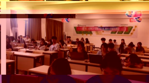
同学们在实训室实训场景